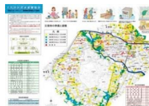
東京都千代田区洪水ハザードマップ