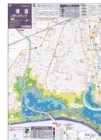
藤沢市津波ハザードマップ