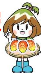
宮崎市観光イメージキャラクター「ミツちゃん」

■公売期日 令和2年6月17日(水) ■受付時間 午前10時00分～10時30分 ■入札会場 宮崎市民プラザ 4階学習室