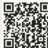
(工期に関する基準)

その他、建設業の時間外労働の上限規制に関するパンフレット及びQ&Aは、こちらから